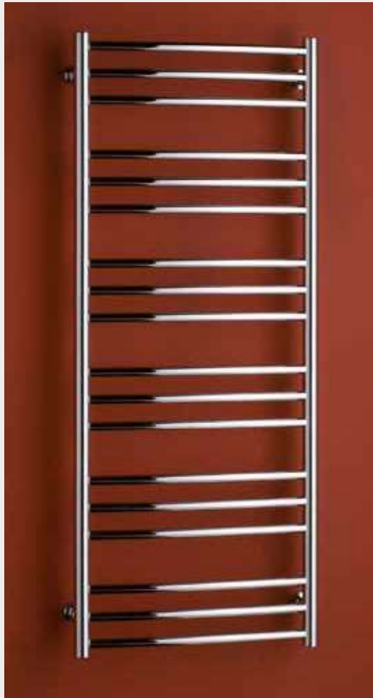
LAVENO – provedení chrom 600 × 1210 mm