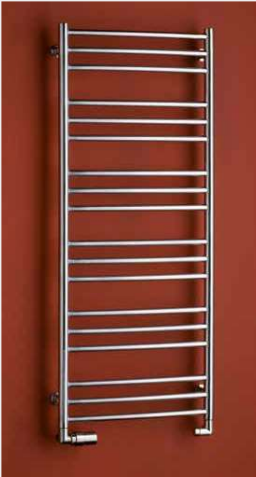
LAVENO – provedení kartáčovaná nerez 500 × 1210 mm