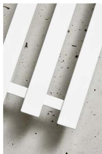
PLUTO P2W/4 provedení bílá 245 x 1500 mm